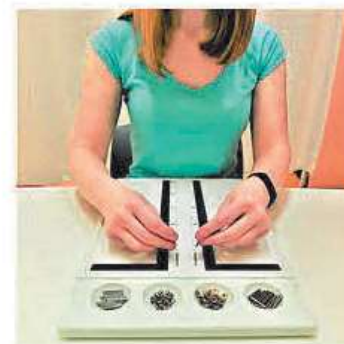
Purdue Pegboard Test