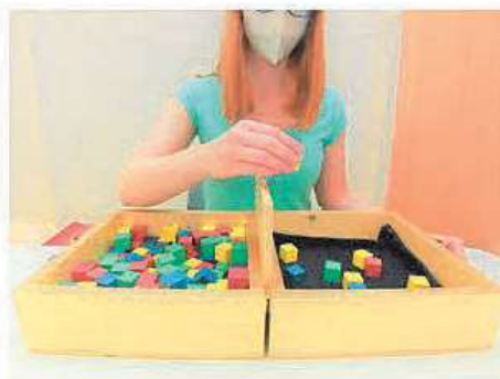
Box and Block Test