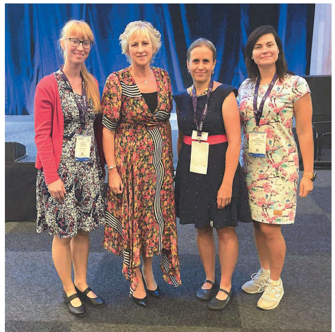
Obrázek 3 Setkání českých ergoterapeutek s prezidentkou WFOT Samanthou Shann