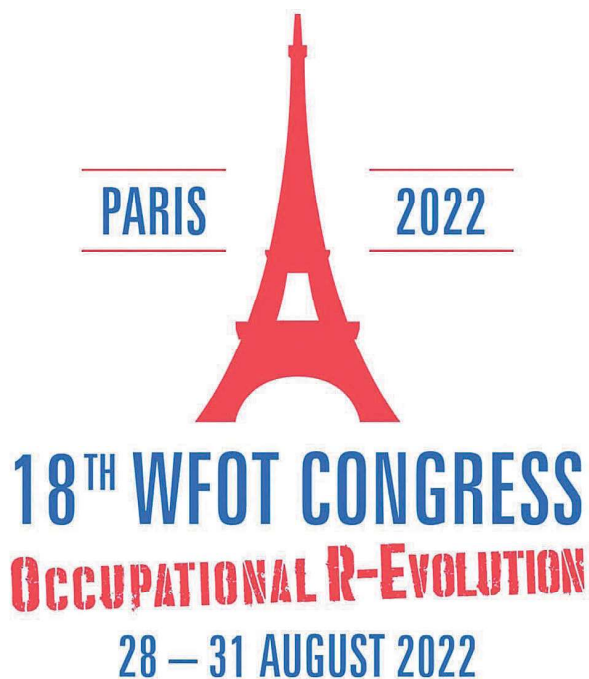
Obrázek 2 Logo WFOT kongresu

Na kongresu byly sdíleny nejnovější poznatky z ergoterapie z celého světa. Z. Rodová se setkala s lidmi, kteří se věnují